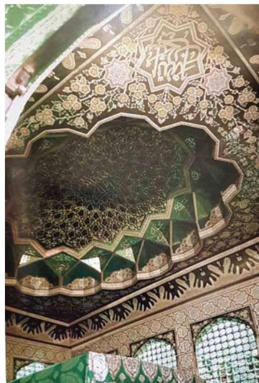
تصویر ۱۵. خاتم کاری درون ضریح سیمین و زرین امام رضا علیه السلام؛ ماخذ: ناصری مهر، ۱۳۹۳، ص ۲۳۰.

کرسی فوقانی؛ درکرسی یا بام فوقانی که به شکل مدور و اصطلاحاً به نام سینه‌کبوتری شهره دارد، نقشی شیدا و شیوا و با ترکیبی از ختایی و قاب‌های خوشایندی که حاوی محرابی‌های مکرر و متداخل که اصطلاحاً لاله‌ای ایستا و لاله‌ی واژگون را با خود داراست و در اصطلاح هنرهای