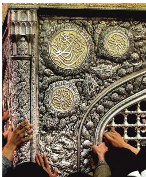
تصویر ۷. تصویر سمت راست لچک محرابی ضریح سیمین و زرین؛ ماخذ: ناصری مهر، ۱۳۹۳، ص ۲۳۷. تصویر ۸. تصویر سمت چپ محرابی‌های تو در تو و پنجره در ضریح سیمین و زرین؛ ماخذ: ناصری مهر، ۱۳۹۳، ص ۲۳۱.