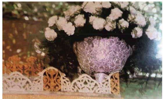
تصویر ۱۲. گلدانی و شرفه‌ها در ضریح سیمین و زرین؛ امام رضا علیه السلام؛ ماخذ: ۵۵ روز در محضر امام، ۱۳۷۲، ص ۲۶.

پنجره محرابی‌های ضریح؛ پنجره محرابی‌های ضریح متشکل از گوی و ماسوره‌هایی است که با بهره‌گیری از صنعت ریخته‌گری و همچنین استفاده از هنر تراشکاری و در نهایت با پرداخت‌گری و یا دواتگری به زینت و آزرین رسیده و در میان خود با اهرم‌های فولادین به یکدیگر متصل می‌گردند. این گوی و ماسوره به‌طور عام از جنس نقره، به جهت ضد میکروب بودنش، مورد استفاده مدام است. گوی و ماسوره همان عنصر مدوری است که در امتداد گوی‌های دیگر با حدفاصل ماسوره‌ها که بواسطه‌ی ابزار خوردگی نرم و شیوا به هم اتصال دارند. این شبکه‌های ضریح که در امتداد یکدیگر در طول و عرض، ایجاد فضای محرابی شکلی مُشرف به درون ضریح و مضجع شریف نموده است و تا زائر حبیب از درون این شبکه‌ها و حال و هوای درون ضریح را به استشمام و نظاره نشانند، به قبولی زیارت خود مطمئن نیست و با دستان خالی خویش را به هر کیفیتی به سمت شبکه‌ها برده و با گرفتن گوی، دستان خویش را با این گوی نورانی پر نموده و با این اتصال،