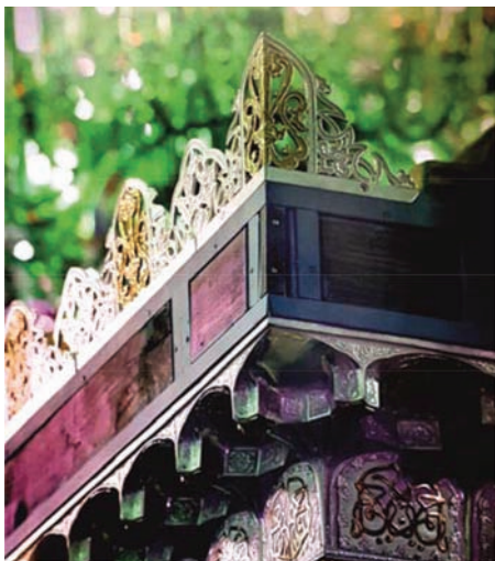
تصویر ۱۱۳. کتیبه دوم، مقرنس و شرفه‌ها در ضریح سیمین و زرین؛ ماخذ: ناصری مهر، ۱۳۹۳، ص ۱۹۲.

شرفه‌های تاج؛ شرفه فرم و شکلی مدور و حد واسطی بین سطح و حجم و فضا می‌باشد که تنها به سطح و حجم خاتمه نیابد. بین هست و نیست و بود و نبود ضریح، شرفه نقش تعیین کننده و ویژه‌ای را داراست. و در بالاترین نقطه‌ی حدّ عدمی بام اول، این شرفه‌ها از جنسی مرکب از طلا و نقره و با ظرافتی خردورزانه با استفاده از نقوش و موتیف‌های اسلیمی، نام مبارک محمد (صلی الله علیه و آله و سلم) با دو صورت متقارن با جنسی از نقره به صورت مشبک و در حالتی با قاب محرابی و بدون قاب آورده شده است. و نام مبارک علی (علیه السلام) با صورتی مشبک متقارن و از جنس طلا ساخته شده است که جملگی فقط با چشمان دقیق و تیز بین مؤمنین دل آگاه قابل رویت است که به شکل رمزآلودی قابل خوانش است. (تصویر شماره ۲ و ۹ و ۱۰ و ۱۲ و ۱۳). شیوه‌ی نگارش این شرفه‌ها به خط مثنی است که با نام‌های خط متعکس، خط آینه‌ای و نام‌های متنوع دیگری از آن یاد شده است. این خط نخست برای مهرسازی کاربرد داشت اما در قطعه نویسی بیشتر مورد استفاده قرار می‌گیرد. در نگارش خط مثنی، به‌خاطر زیباتر شدن در ترکیب و قرینه‌سازی، بیشتر از خط ثلث استفاده می‌شود و مخترع این خط را مجنون رفیق هروی دانسته‌اند. (مقتدائی، ۱۳۹۳، ص ۸۴).