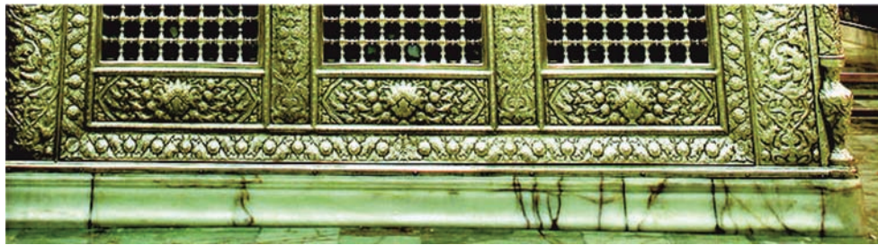
تصویر ۳. پاسنگ، پاسای اول، پاسای دوم و گلدانی ستون اصلی؛ ماخذ: العالم، ۱۳۹۵