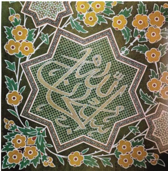
تصویر ۱۶. شمسه هشت‌پر و قاب پیرامونی خاتم کاری شده آن در داخل ضریح سیمین و زرین امام رضا علیه السلام؛ ماخذ: ناصری مهر، ۱۳۹۳، ص ۱۰۸.