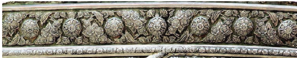
تصویر ۴. نمونه‌ای از تزئینات قاب محوری بزرگ و پاسای اول ضریح سیمین و زرین امام رضا علیه السلام؛ ماخذ: عصر ظهور، ۱۳۹۶