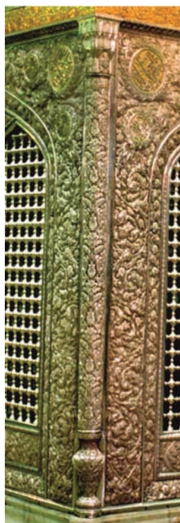
تصویر ۵. تصویر سمت راست، ستون اصلی ضریح سیمین و زرین؛ ماخذ: ناصری مهر، ۱۳۹۳، ص ۲۵۸ و تصویر ۶. تصویر سمت چپ، ستون میانین ضریح سیمین و زرین؛ ماخذ: ناصری مهر، ۱۳۹۳، ص ۱۹۷.