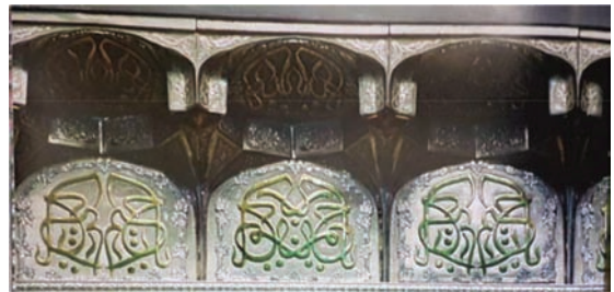
تصویر ۱۱. کتیبه دوم و مقرنس در ضریح سیمین و زرین؛ ماخذ: ناصری مهر، ۱۳۹۳، ص ۱۹۱.

کتیبه اول تاج، در منتهی الیه محرابی‌های مکرر، کتیبه‌ای زرین و طلایی به زینت نگارش سوره‌ی مبارکه‌ی هل اتی و در کمال زیبایی مفردات و ترکیبات خوشنویسی و با خلوتی متعادل با جلوتی متناسب و با خطی خوش و با روان‌خوانی نیکو، در شأن و همتایی با نقوش گردآمده بر تارک این ضریح مبارک، آورده شده است. این نگاشته از جنس طلای برآق بر زمینه‌ای از طلای مات و «به