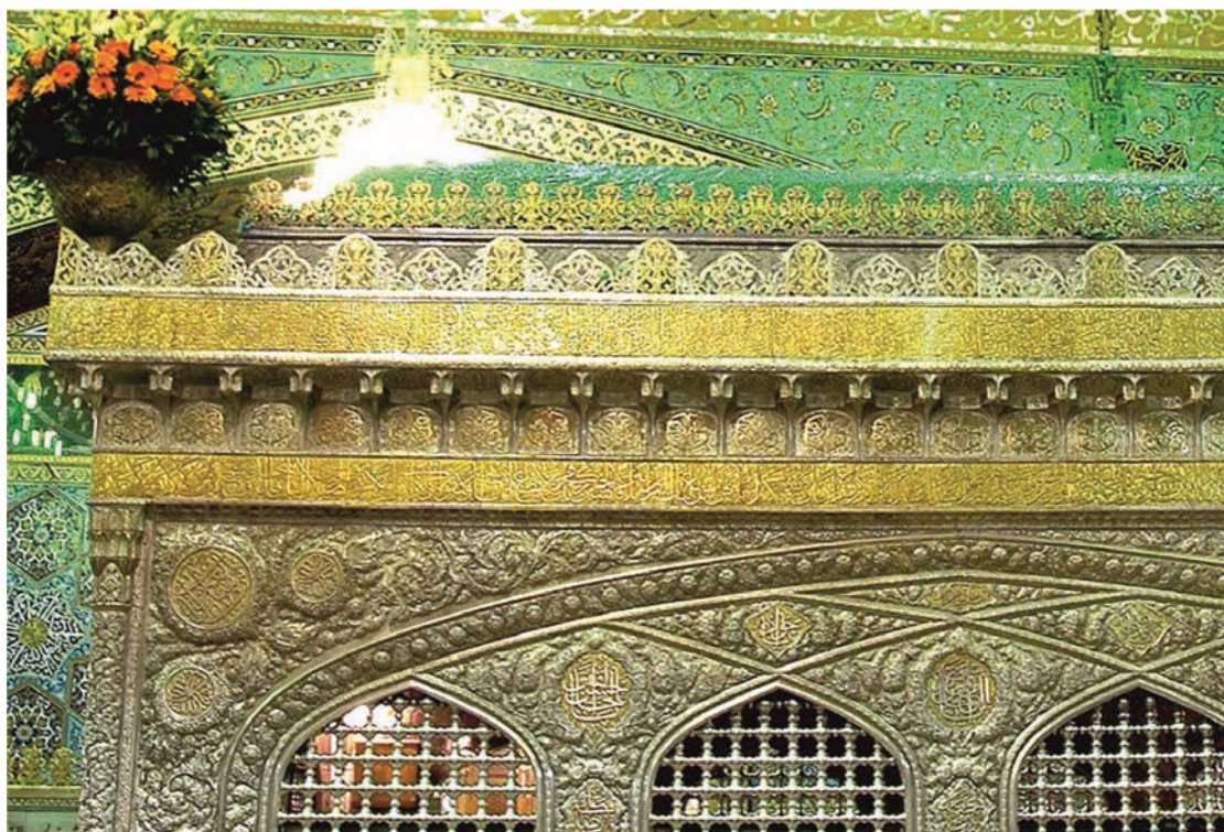
تصویر ۹. محرابی‌های، کتیبه‌ها، تاج، شرفه‌ها و گلدانی در ضریح سیمین و زرین؛ ماخذ: ناصری مهر، ۱۳۹۳، ص ۲۳۷.