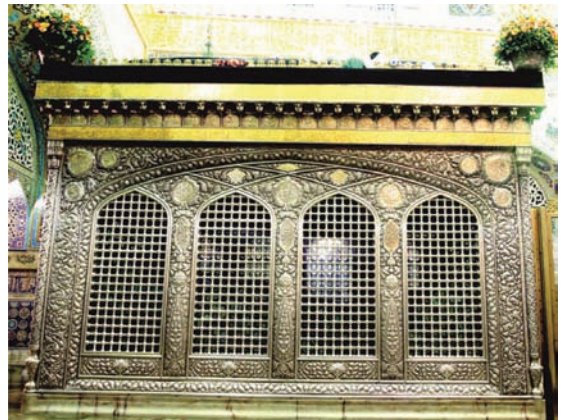
تصویر ۱. ضریح حضرت امام رضا علیه السلام، موسوم به ضریح سیمین و زرین؛ ماخذ: العالم، ۱۳۹۵

با توجه به جایگاه ویژه‌ی زیارت در فرهنگ مسلمانان و ارتباط حسی و عقلی با نقاط عطف اماکن مقدس، عناصر نمادین ارزش ویژه‌ای پیدا می‌کند. از مهم‌ترین این عناصر، بهره‌گیری از نور است. تجلی این نور در مرکز و طواف به دور آن، بازتاب عرش الهی است. هرچه این بازتاب در تزئینات قدسی شبکه‌های ضریح، نقره‌کاری‌ها، قلم‌زنی‌ها و نقوش آمیخته با کلام و مضامین و حیانی، عمیق‌تر باشد، هنرمند قدسی در جایگاه خود، در خلق اثر ماندگار قدسی نقش بهتری ایفا کرده است. «حضور الهی در آرامگاهی که نشان از خلیفه‌اللهی دارد، برای نمایش وحدت فی‌مابین زمین و آسمان، می‌تواند بهترین الگو باشد. وحدتی که همه‌ی غنای عالم را به تنهایی داراست. در این راستا، هنرمندی که بتواند وحدت را در کثرت هنرها و بازگشت کثرت هنرها به وحدت، متجلی نماید، توانسته است به اصول ماندگار خلق معماری فضای زیارت موفق باشد. این مسیر تنها با به‌کارگیری از همه‌ی نقش‌ها و نگاره‌های کلیشه‌ای که در عناصر تزئینی برای مدت زمانی رایج بوده، محقق نمی‌شود بلکه، با پی بردن به اصول حاکم بر شکل‌گیری این هنرها و دلایل قدسی بودن آن، می‌تواند در خلق هنر قدسی بدرخشد.» (روحانی، ۱۳۸۸، ص ۶۲). تجلی نور در مرکز و طواف به دور آن، بازتاب