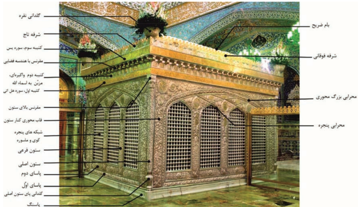
تصویر ۲. جزئیات ضریح سیمین و زرین امام رضا علیه السلام؛ ماخذ: نگارنده

است که از هرسویی به سمت کعبه می‌توان نمازگزارد و صلوات بجای آورد و آن نیز از نه جنس سنگ و گل، بلکه طلا و نقره است. طلا را نماد خورشید خوانده‌اند و نقره را پرتوی از نور ماه، که هر دو تمثیلی آسمانی دارند و فلکی