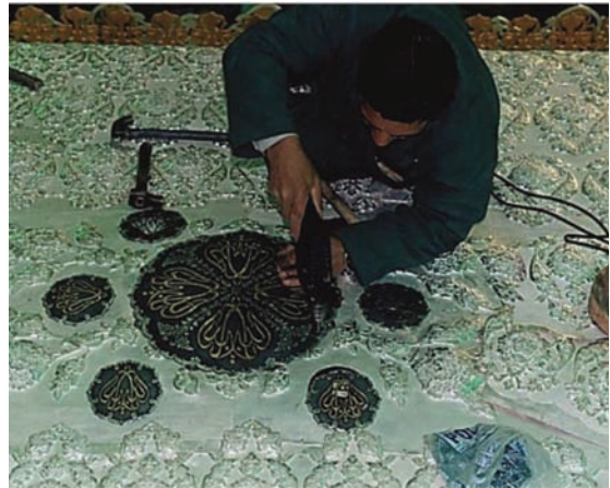
تصویر ۱۴. بام ضریح در حالت نصب در ضریح سیمین و زرین؛ ماخذ: جلالیان سده، ۱۳۹۳، ص ۲۰۵.