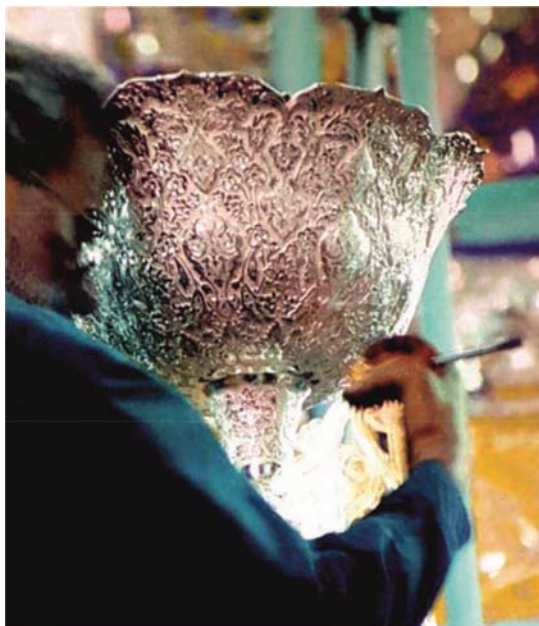
تصویر ۱۷. گلدانی نقره‌ای فوق ضریح سیمین و زرین امام رضا علیه السلام؛ ماخذ: ناصری مهر، ۱۳۹۳، ص ۱۰۸.