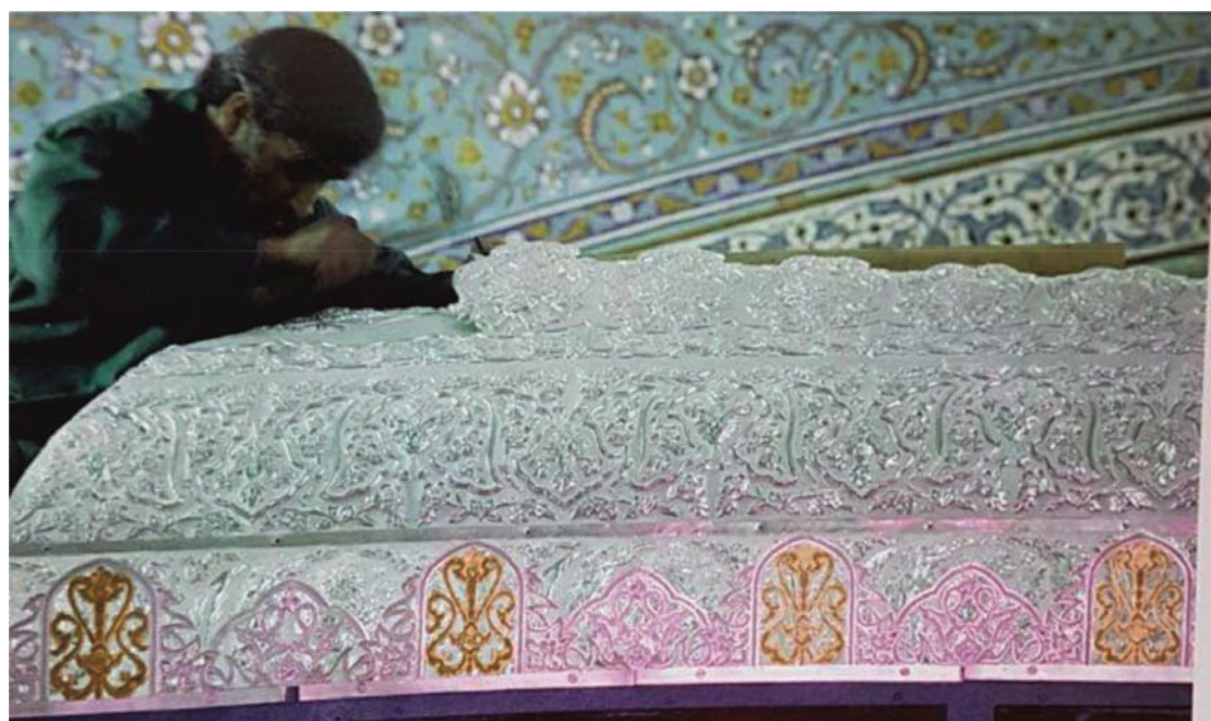
تصویر ۱۰. شرفه‌ها و کرسی فوقانی (بام ضریح) در ضریح سیمین و زرین؛ ماخذ: ناصری مهر، ۱۳۹۳، ص ۱۹۴.