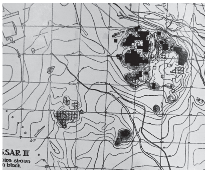
تصویر ۱. نهشته‌های دوره حصار ۳؛ ماخذ: اشمیت، ۱۳۹۲.

و C، تقسیم بندی کرد. هرچند بعداً برخی از پژوهشگران در مورد دوره‌بندی پیشنهادی اشمیت به دلیل این که مبنای وی برای این کار ظروف سفالی‌ای بوده که از تدفین‌ها به دست آورده و جایگاه لایه‌شناختی آن‌ها به درستی روشن نیست، تردیدهایی نشان دادند ولی این دوره‌بندی هنوز به قوت خود باقی است. اشمیت در مورد جایگاه لایه‌شناختی مرحله‌های فرهنگی ۴ و ۵ تردید داشت و آنها را به ترتیب مرحله‌های گذار بین دوره ۱ و ۲، و ۲ و ۳ در نظر گرفت. یکی از اهداف پروژه‌ی بازنگری حصار در ۱۹۷۶ بررسی درستی دوره بندی پیشنهادی اشمیت بود. هیئت بازنگری طی کاوش‌های خود توانست به عمیق‌ترین لایه‌های حصار که معادل دوره ۱ بود دست یابد، اما با تلفیق داده‌های لایه‌شناختی از ترانسه‌های کاوش شده، ۶ مرحله برای نهشته‌های بالایی حصار، که معادل دوره‌های ۲ و ۳ بود، تعریف و از پایین به بالا F تا A نام‌گذاری کردند؛ سپس این مراحل به زیر مرحله‌هایی تقسیم بندی دوباره شد. اما تقسیم بندی هیئت بازنگری چندان مورد توجه و ارجاع باستان‌شناسان قرار نگرفت و دوره بندی اشمیت هنوز اعتبار خود را حفظ کرده است. با وجود این، هیئت بازنگری برای نخستین بار تاریخ گذاری مطلق برای دوره‌های حصار بر اساس نمونه ذغال‌های به دست آمده ارائه داد، به این