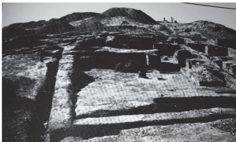
تصویر ۲. ساختمان سوخته؛ ماخذ: اشمیت، ۱۳۹۲.