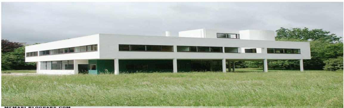
تصویر ۷. ویلای ساوا، اثر لوکوربوزیه. از چستی مسکن به کیستی مسکن: از ویلای ساوا به معمار آن: لوکوربوزیه؛ ماخذ: نگارنده رساله؛ ماخذ: تصویرک وبلاگ معماری بلاگ پارس، زمان برداشت: ۱۳۹۶.

هر انسانی منسوب به تجربه او از زادگاه خودش است. بعبارت دیگر چنانچه تفسیری چه نوشتاری و چه گفتاری در خصوص خانه مطرح شود. هر شخصی ابتدا آن موضوع را با برداشت‌های ذهنی خود