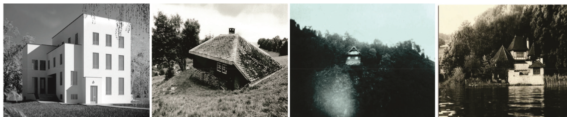
از راست به چپ: کارل گوستاو بونگ - برج بولینگن بر ساحل دریاچه زوریخ، لوئویگ وینگشتاین - کلیه ای در شلون، مارتین هایبگر - کلیه ای در جنگل سیاه، لوئویگ وینگشتاین - خانه ای در وین

تصاویر ۱ الی ۴. نمونه هایی از خانه معروف در تاریخ معماری؛ ماخذ: مهدوی نژاد، ۱۳۹۰.