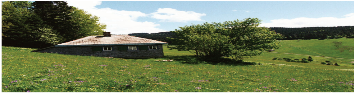
تصویر ۶. کلبه روستایی و مسکن مطلوب هایدگر؛ ماخذ: hassan-afshin.blog.ir

ارزش‌گذاری خصایص برجسته و یا تحلیل علت راحتی آنها نیست بلکه برعکس، بایستی از توصیف، پافرا تر نهیم - چه توصیف عینی چه ذهنی - یعنی آنکه آیا این توصیفات بیانگر حقایق است یا احساسات» (باشلار، ۱۳۹۲، ص. ۴۴) باشلار معتقد به مکان‌کاوی بود. او معنای مکان را در در عرصه‌های زندگی خصوصی انسان درک کرده بود و تنها راه دریافت شناخت از این فضا را کاوش در ضمیر ناخودآگاه ساکنین آن می‌دانند. چنین دست مطالعات روان‌شناسی در فضای مسکونی از آن جهت حائز اهمیت است که دیدگاه محققان در این زمینه را با نوعی از فضای جدید معماری آشنا می‌سازد که مولفه‌های سازنده آن تنها ابعاد فیزیکی و زیبایی شناسانه نبوده، بلکه تا حدود زیادی بار اجتماعی و روانی را در بردارد.