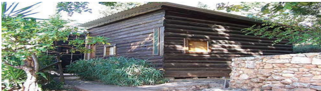
تصویر ۸. کلبه شخصی لوکوربوزیه؛ در سواحل جنوبی فرانسه.

البته جای تعجب ندارد که به دلایل متعددی از جمله عدم ثبات و نبود حقوق شهروندی و امنیت اجتماعی، هر خانواده‌ای تأمین امنیت را دغدغه اصلی خود می‌داند که در خانه خود را نشان