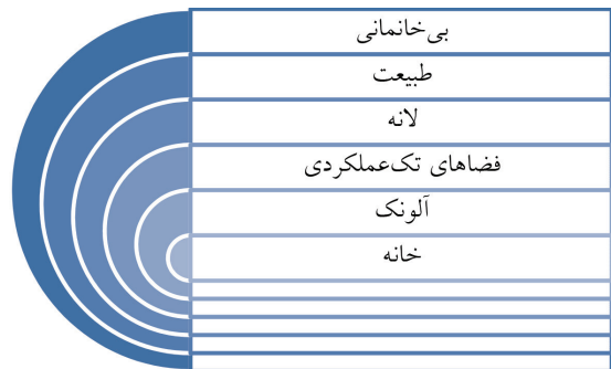
نمودار ۱. ابعاد روند سکونت زیستی بشر؛ ماخذ: نگارندگان.

مقایسه معانی این واژه در دو فرهنگ فارسی و انگلیسی نشان از این دارد که در زبان انگلیسی یک بار معنایی بر این لغت وارد است که چنین چیزی در فرهنگ فارسی مشاهده نمی شود و این بدان معناست که در ادبیات فارسی سکونت بیشتر بار مکانی داشته ولی در ادبیات انگلیسی علاوه بر بار مکانی بار زمانی را نیز دارا می باشد. یعنی بر مدت زمان وقوع فعل نیز دلالت داشته و سکونت را در صورت تداوم زمانی فعل معنا دار می داند. از طرفی دیگر در فرهنگ فارسی معادل مشتقات لغت آرام را می بینیم که در ادبیات انگلیسی مشاهده نمی شود. و این بدان معناست که واژه سکونت در ادبیات فارسی با نوعی تضاد در رد جهان بیرونی مشاهده می شود که در آنجا به آرامش و سکون خواهیم رسید و در صورتیکه در ادبیات انگلیسی بر تداوم زمانی و مکانی به منظور وقوع فعل زندگی، تاکید می شود.