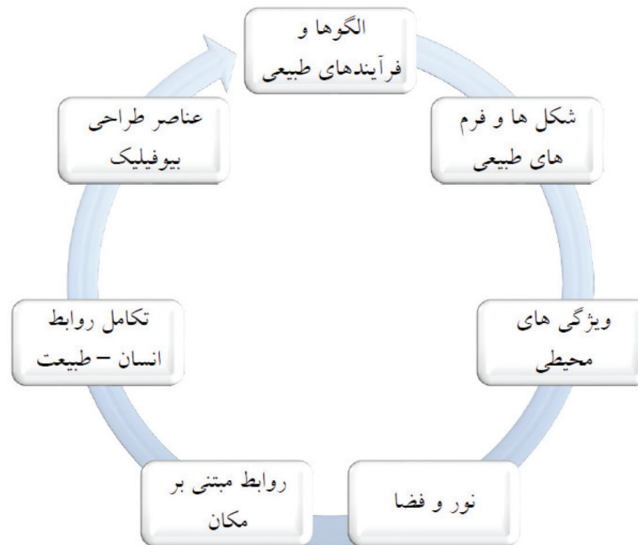
تصویر ۳. عناصر طراحی بیوفیلیک؛ منبع: Kellert, 2008