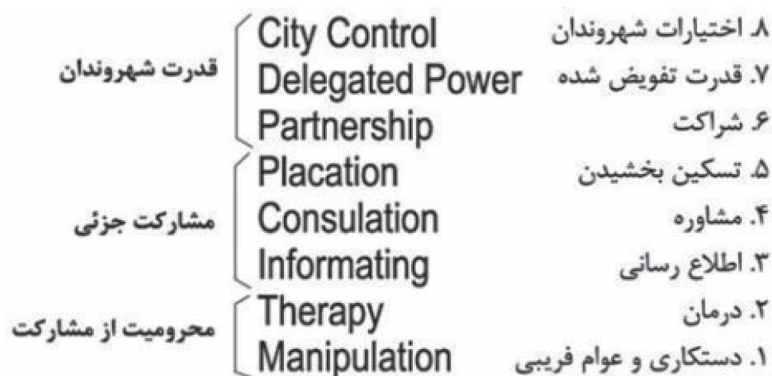
شکل ۱. مراحل مشارکت شهروندان در ساماندهی بافت‌های فرسوده شهری؛ منبع: حبیبی و همکاران، ۱۳۸۴، ص ۱۷

دست می‌یابند. همانگونه که از این پیش نشان داده شده، «پی آمد روانشناختی مردم» در مدیریت پشتیبان، احساس «مشارکت» است که برای کارکنان فراهم می‌آید. بر این پایه می‌توان گفت که مشارکت یک درگیری ذهنی و عاطفی اشخاص در موقعیتهای گروهی است که آنان را بر می‌انگیزد تا برای دستیابی به هدفهای گروهی یاری دهند و در مسئولیت کار شریک شوند. (لرن پلونکت، ۱۳۸۱، ص ۳).