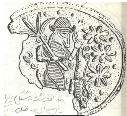
تصویر شماره ۶

(تصاویر برگرفته از کتاب هنر در ایران، اثر پروفسور آندره گذار: ۶۳ و ۶۴)