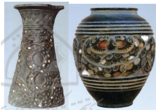
تصویر شماره ۱- دو مار درهم پیچیده خشمگین

پیش‌نمایش ذات شرّ، خواهان جاودانگی و بی‌مرگی انسان نیست (ر.ک. الیاده، ۱۳۷۲: ۲۰۷ و ۲۷۷). این باور، جنبه گروتسکی مار را برجسته‌تر می‌کند؛ موجوی که با داشتن ظاهری زشت، ترسناک و مضمّن کننده، نماد باروری، حیات و بی‌مرگیست. در بسیاری از نقوش، مار و انسان همراه هم هستند و این می‌تواند به اسطوره وسوسه مار و آدم مرتبط باشد. چنان‌که در کتاب «a history caricator & grotesque» نیز به این ماجرای اسطوره‌ای آن اشاره شده است. عقرب نیز مانند مار، در گروه حیوانات گروتسکی‌ست. موجودی آسیب‌رسان، نازیبا و اهریمنی که تصویر آن در این نقوش به این باور بازمی‌گردد که عقرب، یک موجود زیانکار، دارای قدرت جادویی است و چون تعویذی در برابر نیش زهرآلود قرار می‌گیرد (ر.ک. هال، ۱۳۸۷: ذیل کژدم).