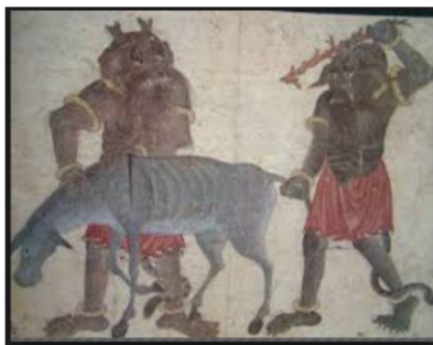
تصویر شماره ۱۰

نگهبانان معابد بر روی اشیاء و ظروف پیدا شده است. این ترکیب‌های انسانی-گیاهی و یا حیوانی - گیاهی در دوره اسلامی با عنوان واق مورد توجه هنرمندان در عرصه‌های گوناگون قرار گرفته است. «قدیمی‌ترین نمونه‌های تصویری موسوم به واق، به سده ششم ه. ق. (دوره سلجوقی) بازمی‌گردد و اندک اندک از سده هشتم به بعد به یکی از شیوه‌های نقاشی ایرانی مبدل می‌شود» (تختی و افهمی، ۱۳۹۲: ۸۲). این شیوه در عصر تیموری در آثار محمد سیاه‌قلم به اوج خود رسید. نقاشی‌های او از برجسته‌ترین نمونه‌های گروتسک در هنر ایران است. در تصاویر او علاوه بر ترکیب عناصر انسانی، گیاهی و حیوانی، موجودات عظیم‌الجثه، دیوها، غولان و توجه به بدن و جسم - که پیوند نزدیکی با بدن گروتسکی باخنین دارد - و به طور کلی پیوند عناصر متناقض وحشت و طنز، دیدگاه گروتسکی منحصر به فرد او را نشان می‌دهد.