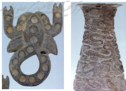
تصویر شماره ۲- کژدم دهشت‌آور

(تصاویر برگرفته از کتاب جیرفت، کهن‌ترین تمدن شرق: ۹۸ و ۹۹ و ۱۱۴ و ۱۳۶)