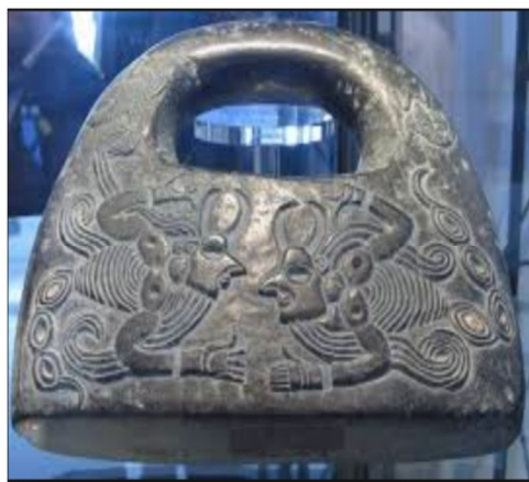
تصویر شماره ۳- ترکیب انسان - عقرب

نقوش دیگری که دلالت بر حضور گروتسک در تمدن کهن جیرفت می‌کند، موجودات عجیب و غریب، مضحک، غیرمعمول و ناهنجار است. انسان‌های شاخدار، موجودات افسانه‌ای و ترکیبی، انسان - عقرب، انسان - گاو، انسان - شیر و... که مکرر در نقوش کهن دیده می‌شود، بیانگر آن است که در نگاه اقوام کهن، انسان ترکیب یا هم‌نهادی از جهان است و شباهت و ارتباط قابل ملاحظه‌ای میان عناصر تشکیل‌دهنده انسان و کائنات وجود دارد. از طرفی، این موجودات ترکیبی بازگوکننده اعتقادات مردم باستان درباره خداوند نیز هستند. زیرا قدما معتقدند خداوند شبیه انسان است و در عین حال با او تفاوت دارد؛ در نتیجه این تصور خود را با موجودات ماورایی و عجیب نشان می‌دهند (ر.ک. حسین‌آبادی، ۱۳۹۵: ۱۵).