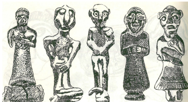
تصویر شماره ۷