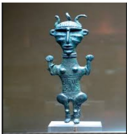
تصویر شماره ۹