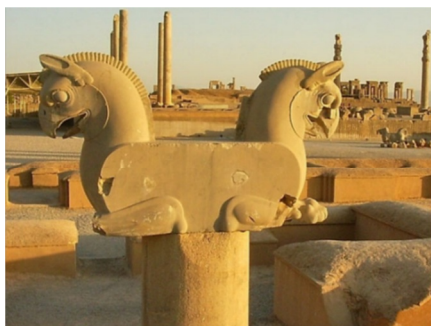
تصویر شماره ۱۳، نمایی از گریفن‌ها در تخت جمشید

جنبه‌های گروتسک در گارگویل‌ها، موجودات عجیب، هیولایی و ترکیبی، در معماری کلیساها و تخت جمشید برجسته است. اگرچه در معماری، سبکی با عنوان گروتسک نداریم، اما ترکیب‌های به کار رفته در کلیساها و معماری تخت جمشید، ستون‌های بلند، باریک و اغراق‌آمیز، موجودات عجیب‌الخلقه، مجسمه‌هایی با دهان‌های باز و چهره‌های هولناک که ترس، وحشت و فریاد را القاء می‌کنند، مفاهیمی است که در دوره‌های مختلف تاریخ معماری در بناها دیده می‌شود. مفاهیمی که بُعد منفی گروتسک در آن پررنگ است. یعنی هراس، دلهره، ابهام و حس انزجار را در مخاطب برمی‌انگیزد و در نتیجه مجموعه‌ای درهم و برهم از غرابت، زمختی و تمسخر می‌شود که تأثیری غریب و غم‌انگیز بر او باقی می‌گذارد (ر.ک. خواجه‌پاشا، ۱۳۹۵: ۱۰).