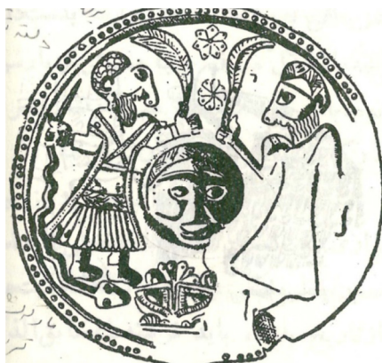
تصویر شماره ۵

عقرب است که برخلاف تصویر قبل، سر به صورت انسان و نیم‌تنه پایین، در فرم عقرب است. نمونه‌های بسیاری از تصاویر اغراق‌آمیز، دهشت‌آور، تخیلی، ناهنجار و مضحک در بین این نقوش دیده می‌شود که باورها و عقاید مذهبی، فرهنگی و تخیل آفرینشگر مردم این تمدن کهن را به تصویر می‌کشد و جایگاه هنر گروتسک را آشکار می‌سازد؛ نقوشی که آمیخته است از تصاویری چون: خدای باروری، خدای باران، خدای جنگل و... که با عقاید مردم آن زمان گره خورده، به همراه برخی سنجاق‌های تزئینی که جهت رسومی چون سپاسگزاری از زایمان و طلب رحمت و برآوردن حاجت استفاده می‌گردیده است (ر.ک. گذار، ۱۳۵۸: ۴۷-۶۷). در تصاویر ۵ و ۶ و ۷ نمونه‌ای از این موارد نشان داده شده است. در تمام این نقوش عناصر گروتسک حضور دارد.