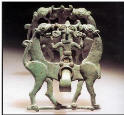
تصویر شماره ۸