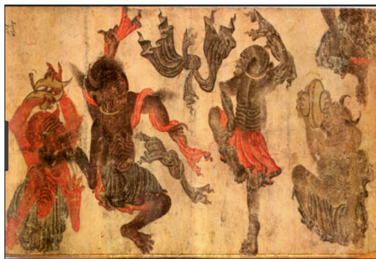
تصویر شماره ۱۱

(تصاویر برگرفته از کتاب استاد محمد سیاه قلم، نابغه‌ای فراموش شده: ۲۱ و ۲۵)