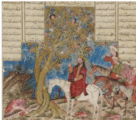
تصویر شماره ۱۲، گفت‌وگوی اسکندر و درخت سخنگو

این درخت که در اساطیر ایران جنبه مثبت دارد و در متون ادبی نیز با همین رویکرد به آن پرداخته شده است، نشانی‌ست برای توصیف افسانه و دادن بُعد عقلانی به آن و به واسطه سخنوری‌اش، آن را نماد خرد و مظهر باروری و جاودانگی دانسته‌اند (ر.ک. تختی، افهمی ۱۳۹۰: ۵۹-۶۰ و ۶۷).