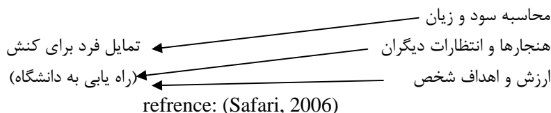
جدول ۱- رابطه بین متغیر و نظریه منتخب