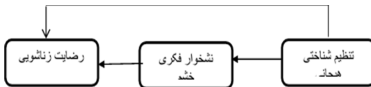
شکل ۱- مدل مفهومی