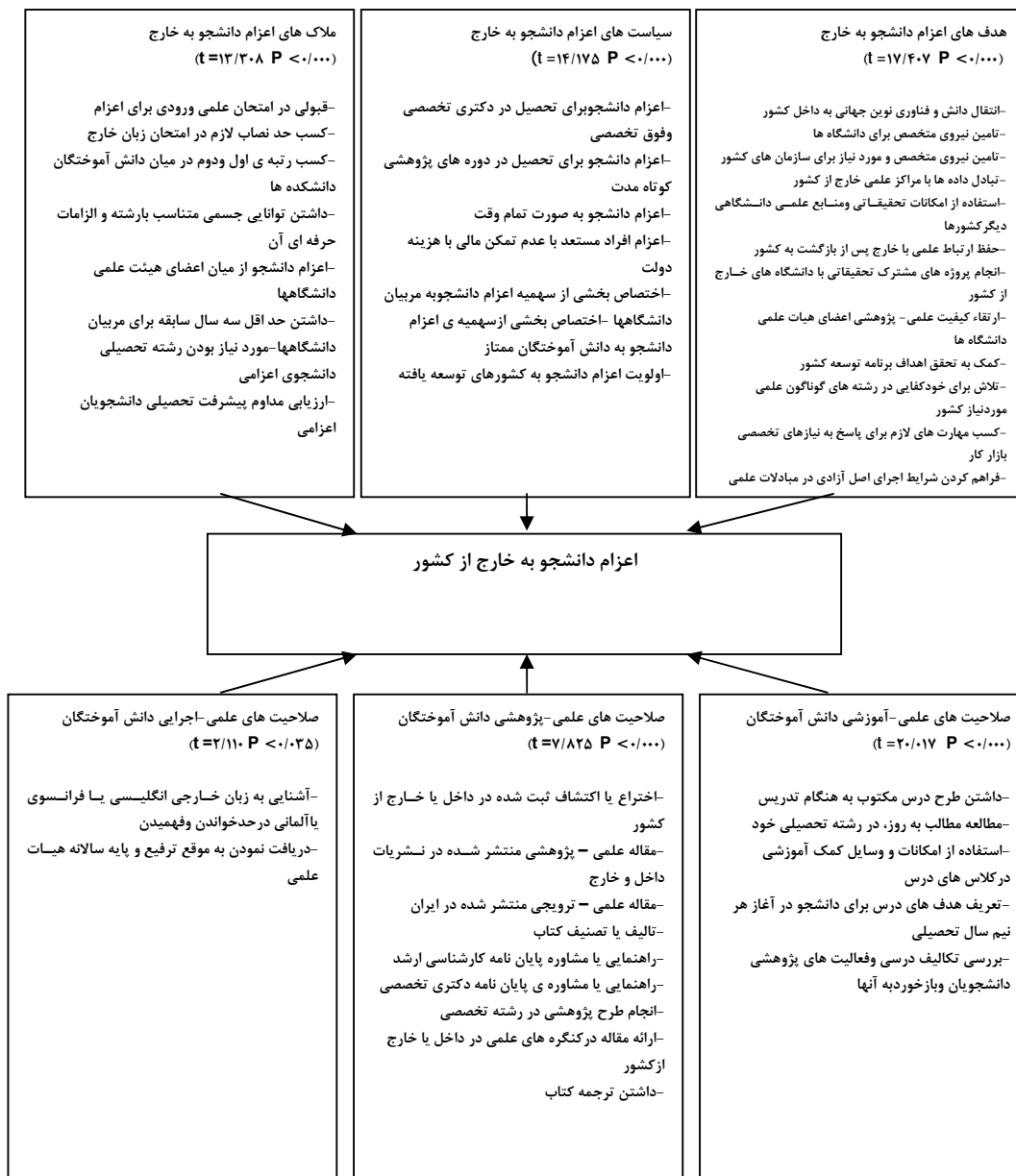
شکل ۳: چارچوب ادراکی پیشنهادی نهایی اعزام دانشجو به خارج از کشور