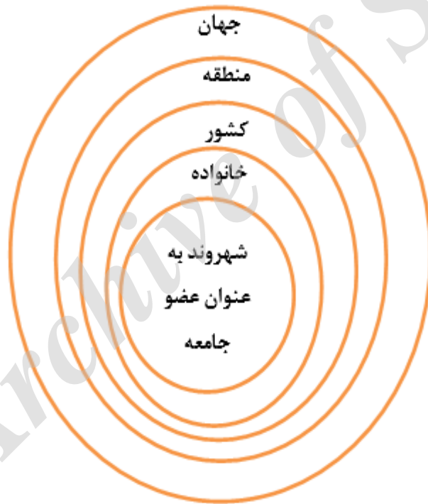
شکل ۱. رویکرد کل نگر آموزشی شهروندی منبع: لادرس و کویسام بینگ ۱ (Ghorchiyan & Eftekhazadeh, 2006)

مانند تصادف جنگ، همه‌گیری ایدز، فقر جهانی و ... مشارکت فعال و کلیدی داشته باشد. همچنین آموزش شهروندی باید به افراد کمک کند تا شناخت شفاف و درستی از نقش خود در جامعه جهانی کسب نمایند و درک کنند، چگونه زندگی آن‌ها در جوامع فرهنگی‌شان، زندگی ملل دیگر را تحت تاثیر قرار می‌دهد و چگونه رویدادهای جهانی می‌توانند زندگی روزمره آن‌ها را تحت تاثیر قرار دهند. به‌طور کلی قلمرو برنامه‌های تربیت شهروندی به مرزهای ملی محدود نمی‌شود. بر این اساس، چرخه اجتماعی آموزش شهروندان از قلمرو فردی آغاز و سپس به خانواده، اجتماع محلی، ملی، منطقه ای و جهانی گسترش می‌یابد و در یک بافت تعاملی و متأثر از هم، با هم مرتبط هستند (Ghorchiyan & Eftekhazadeh, 2006) (شکل ۱).