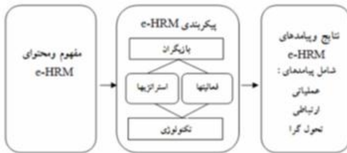
شکل ۲: اجزای مدیریت منابع انسانی الکترونیک (Strohmeier, 2007)

به بهره‌وری و اثربخشی خروجی‌های مدیریت منابع انسانی الکترونیک از قبیل کاهش هزینه‌ها یا کاهش فشار اجرایی مدیریت مربوط می‌شوند. نتایج ارتباطی بر پدیده ارتباط متقابل و شبکه‌بندی عاملان مختلف تأکید دارد و نتایج تحول‌گرا، تغییرات اساسی مربوط به چشم انداز و کارکرد کلی مدیریت منابع انسانی که مشخص کننده توانایی آن در کمک به عملکرد کلی سازمان است، را هدف قرار می‌دهد.