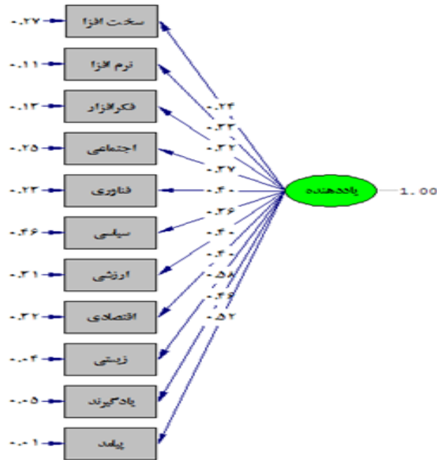
شکل ۲- مدل اصلی تحقیق

بر اساس نتایج به دست آمده از آمار توصیفی، شرکت کنندگان در این پژوهش ۶۸/۲ درصد مرد و ۳۱/۸ درصد زن بودند. سن ۰/۹ درصد از شرکت کنندگان بین ۲۰ تا ۲۵ سال، ۵/۸ درصد بین ۲۶ تا ۳۰ سال، ۶/۹ درصد بین ۳۱ تا ۳۵ سال، ۱۶/۶ درصد بین ۳۶ تا ۴۰ سال و ۶۹/۸ درصد ۴۱ سال و بیشتر بوده است. ۶/۵ درصد از شرکت کنندگان مجرد و ۹۳/۵ درصد متأهل بودند. میزان تحصیلات ۴/۵ درصد از شرکت کنندگان لیسانس، ۶۴ درصد فوق لیسانس و ۳۱/۵ درصد دکتری بود. سابقه کار ۶ درصد از شرکت کنندگان بین ۱ تا ۵ سال، ۶/۳ درصد بین ۶ تا ۱۰ سال، ۵/۴ درصد بین ۱۱ تا ۱۵ سال، ۱۵/۵ درصد بین ۱۶ تا ۲۰ سال و ۶۶/۸ درصد ۲۱ سال و بیشتر بوده است.