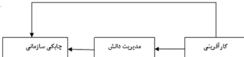
شکل ۲- مدل مفهومی تحقیق

هم‌چنین این که نتیجه‌گیری در زمینه ارتباط کارآفرینی با چابکی با واسطه‌گری مدیریت دانش نیازمند تحقیقات گسترده است و بررسی پیشینه پژوهش‌های انجام شده نشان می‌دهد کمتر انجام گرفته است؛ پژوهش حاضر به دنبال رفع کمبودهای پژوهشی موجود به دنبال پاسخگویی به این سوال است که آیا مدیریت دانش نقش میانجی‌گری معنادار بین کارآفرینی سازمانی و چابکی سازمانی در استادان دانشکده فنی پسران مرودشت ایفا می‌کند.