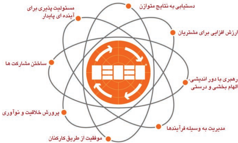
شکل (۱) - مفاهیم بنیادین تعالی سازمانی

جایزه ملی جهت پیاده سازی این مفاهیم و ارائه چهارچوبی اجرایی برای نهادینه سازی مفاهیم بنیادین، الگوی تعالی سازمانی ۲ خود را مطابق شکل (۲) طراحی و ارائه نموده است. این الگو به دو حوزه اصلی تقسیم می‌شود: توانمندسازها ۳ و نتایج ۴ .