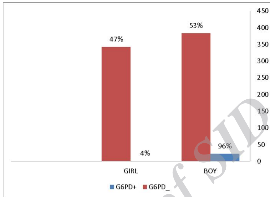
شکل ۲: توزیع جنسی کمبود آنزیم G6PD