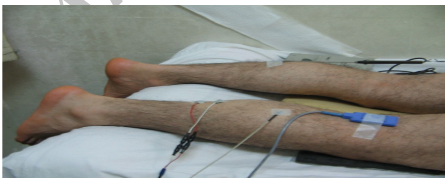
شکل 2- چگونگی قرار گیری فرد و الکترودهای ثبت و تحریک و دماسنج (ثبت در آزمایشگاه الکتروفیزیولوژی دانشگاه تربیت مدرس)

این مطالعه توصیفی در 6 فرد داوطلب سالم، 2 زن و 4 مرد با میانگین سنی 26/33 \pm 1/033 سال با روش نمونه گیری در دسترس، انجام شد. هر 6 نفر راست پا و غیر ورزشکار بودند. روند مطالعه توسط کمیته اخلاق دانشگاه تربیت مدرس تایید شد. معیارهای ورود عبارت بودند از: سلامت عصبی عضلانی اسکلتی و نداشتن محدودیت حرکتی در مچ پا و زانو. معیارهای خروج عبارت بودند از: استفاده از داروهای موثر بر سیستم عصبی عضلانی اسکلتی، اختلالات حسی و انجام ورزش حرفه ای حداقل سه روز در هفته. پس از گرفتن موافقت کتبی، داوطلب فرم اطلاعات زمینه‌ای را پر می‌کرد و پس از اطمینان از سلامت فرد، خواب کافی شبانه، عدم خستگی عمومی و عضلانی و عدم مصرف داروهای مسکن و آرامبخش و پس از تطابق فرد با شرایط محیط، ثبت پاسخ H' در ساعات بین 8-11 صبح صورت -