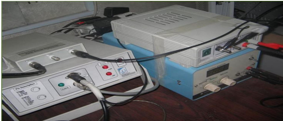
شکل 1- دستگاه ساخته شده در مطالعه

در ایران صورت گرفت. هدف از این مطالعه بررسی تکرارپذیری