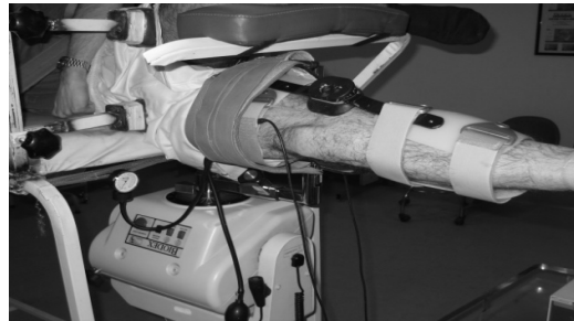
شکل 2- آزمون سفتی عضلات همسترینگ و رکتوس فموریس از سر پرو گزیمال در وضعیت زانوی راست

می‌شد و همچنین از عدم تغییر فشار در حین آزمون اطمینان حاصل می‌گردید. زانوی فرد به کمک بریس در وضعیت اکستنشن کامل بی حرکت می‌شد و دستگاه جهت حرکت دادن اندام فرد به صورت غیر فعال در جهت فلکشن واکستنشن ران در طی دامنه 25 درجه اکستنشن ران تا 80 درجه فلکشن ران با سرعت زاویه‌ای ثابت 2 درجه بر ثانیه تنظیم می‌شد (شکل 2).