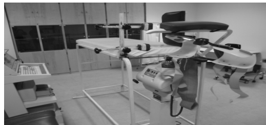
شکل 1- چیدمان ساخته شده مورد استفاده جهت اندازه‌گیری سفتی عضلانی

رکتوس فموریس از یک تخت معاینه استفاده شد که برای مناسب نمودن آن، 110 سانتیمتر به پایه‌های آن افزوده شد (شکل 1). فرد مورد آزمون روی پهلوئی راست به گونه‌ای روی تخت می‌خوابید که ستیغ ایلیاک سمت راستش روی لبه تخت تکیه داشت و تروکانتر بزرگ فمور بیرون تخت قرار می‌گرفت. لگن فرد از عقب به یک صفحه پشتی تکیه داده می‌شد و از جلو با قرار دادن دو ابزار بی حرکتی روی برآمدگی‌های خار خاصه قدامی فوقانی و ثابت کردن آنها، لگن کاملاً بی حرکت می‌شد.