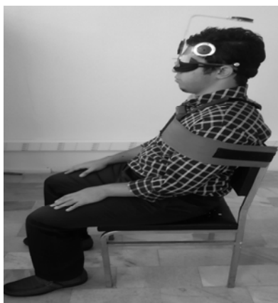
شکل ۱- نحوه‌ی نصب دستگاه CROM

زاویه‌ی نوترال را بازسازی کند. در هر جهت، ۳ مرتبه حرکت تکرار می‌شد و پس از محاسبه‌ی میانگین زاویه‌های به دست آمده، قدرمطلق تفاوت میانگین زاویه‌ی هدف و زاویه‌ی ایجاد