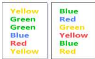
شکل ۱: آزمون استروپ

این کلمات به صورت تصادفی و متوالی نمایش داده می شود که هدف از این مرحله انعطاف پذیری ذهنی، تداخل و بازداری می باشد (۲۰). اعتبار این آزمون بر اساس مطالعات انجام شده ۰/۸۳ گزارش شده است (۲۱). (شکل ۱)