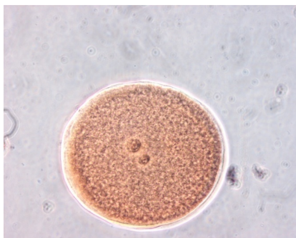
شکل ۲: اووسیت بارور شده که پرونوکلئوس‌های آن به وضوح قابل مشاهده هستند.