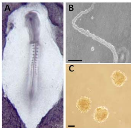
شکل ۱: تصویر میکروسکوپ فاز کنتراست از جنین جوجه در مرحله ۱۰ سوماتیتی (A) و نوتوکورد (B) و سوماتیت‌های جدا شده از این جنین (C). Bar= 100 μm.

بعد از استخراج جنین جوجه در مراحل ۱۰ تا ۱۲ سوماتیتی از سطح زرده (شکل ۱A) و جداسازی نوتوکورد (شکل ۱B) و سوماتیت از آن (شکل ۱C)، سوماتیت‌ها در ظروف حاوی محیط کشت قرار داده شدند (شکل ۲A). بررسی‌های مورفولوژیکی در گروه‌های مورد مطالعه نشان داد که سلول‌های سوماتیتی پس از دو روز کشت با نوتوکورد و نیز بدون حضور نوتوکورد از گوشه‌های سوماتیت شروع به رشد و تکثیر نموده (شکل E و ۲B) و پس از شش روز کشت توانستند به‌صورت سلول‌هایی با ظاهر سلول‌های مزانشیمی تمایز یابند؛ اگرچه تعداد این سلول‌ها در گروه بدون هم‌کشتی کمتر بود (شکل F و ۲C). از طرف دیگر، مطابق با شکل ۲D سلول‌های مزانشیمی از یک جسم سلولی