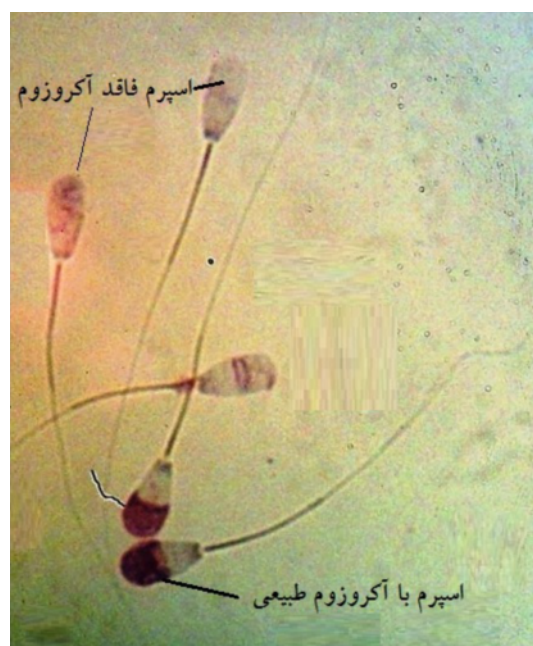
شکل ۱: تصویر اسپرم‌های با آکروزوم طبیعی و فاقد آکروزوم