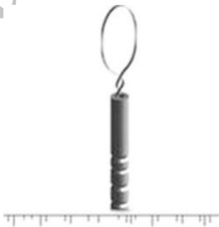
شکل ۳: کرایولوپ

- کرایولوپ: کرایولوپ متشکل از یک حلقه نایلونی است (شکل ۳) که می‌تواند حجم کوچکی از نمونه اسپرمی را با استفاده از عمل مویرگی به دام ببندد. این کرایولوپ‌ها ابتدا برای ذخیره سازی جنین‌ها مورد استفاده قرار می‌گرفتند اما امروزه این روش برای ذخیره سازی حجم کمی از نمونه‌های اسپرمی مورد استفاده قرار می‌گیرند. این روش در سال ۲۰۰۳ مورد مطالعه قرار گرفت. مزایای استفاده از این روش شامل سهولت بازیابی و عدم قرار