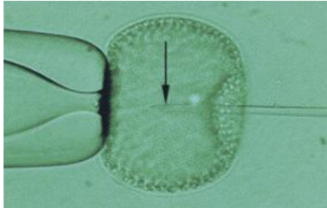
شکل ۲: هدایت اسپرم با استفاده از یک پیپت ICSI به درون یک کلونی جلبک ولوکس به عنوان یک حامل زیستی

سپس با استفاده از یک پروتکل معمولی فریز اسپرم منجمد می‌شوند. میزان بازیابی اسپرم‌ها پس از ذوب با