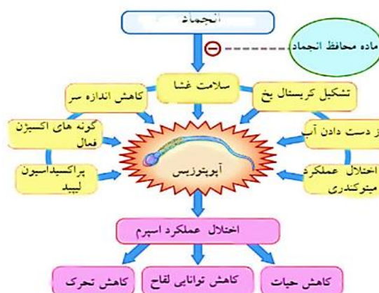
شکل ۵: عوامل ایجاد آپوپتوزیس در اثر فریز و نتایج آن

اثر فریز بر مورفولوژی اسپرم: مورفولوژی اسپرم نیز از دیگر پارامترهایی است که تحت تاثیر فریز اسپرم قرار