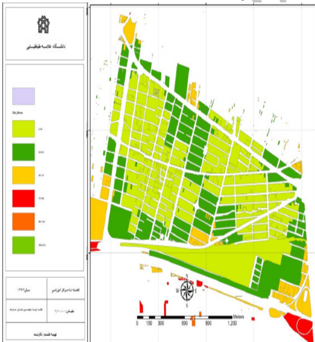
شکل شماره ۳: توزیع مراکز آموزشی امن محله برای اسکان اضطراری پس از زلزله

در ضوابط طراحی برای مراکز آموزشی ابتدایی سطح کل زیربنا از ۴۰ درصد سطح کل زمین نباید تجاوز کند و حداقل سطح آزاد ۶۰ درصد سطح زمین باشد. در مدارس راهنمایی حداکثر سطح کل زیربنا در طبقات از ۵۰ درصد تجاوز نکند و در دبیرستان‌ها زیر بنا نباید از ۴۰ درصد سطح کل زمین تجاوز کند (۱۷). در محدوده مورد مطالعه ۳۰ درصد مراکز آموزشی دارای فضای باز کافی و ۹ درصد آنها دارای فضای باز با مساحت کم می‌باشند. سایر مراکز فاقد فضای باز هستند.