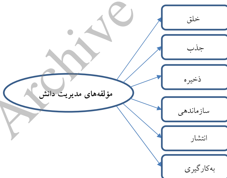
شکل شماره ۱: مدل ارائه شده توسط شرون لوسون (۲۰۰۳)

برای تعیین مؤلفه‌های مدیریت دانش در پژوهش از مدل شرون لوسون که متغیر مدیریت دانش را مشتمل بر شش مؤلفه خلق، جذب، سازماندهی، ذخیره، انتشار و به‌کارگیری دانش می‌داند، استفاده گردیده است.