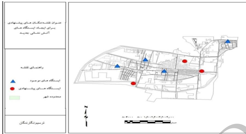
شکل شماره ۲: ارزش گذاری نهایی زمین های شهری برای ایجاد ایستگاه های آتش نشانی