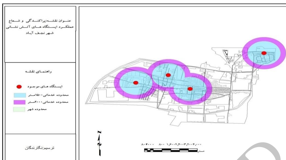
شکل شماره ۴: پراکندگی و شعاع عملکرد ایستگاه‌های آتش‌نشانی شهر نجف‌آباد

زمینی در قسمت جنوب غربی بیمارستان الزهرا و همجوار با کمر بند جنوب است. نزدیکی به مناطق مسکونی، خیابان اصلی و بیمارستان از مزایای این قطعه زمین می‌باشد. برای ناحیه ۵ نیز، مکان مناسب برای احداث ایستگاه جدید، انتهای خیابان فرخی می‌باشد و برای ناحیه ۲، در نزدیکی پارک ارکیده بهترین مکان پیشنهاد شده می‌باشد. هسته مرکزی شهر نیز به دلیل تراکم بالای جمعیت نیاز مبرمی به ایجاد حداقل یک ایستگاه جدید دارد.