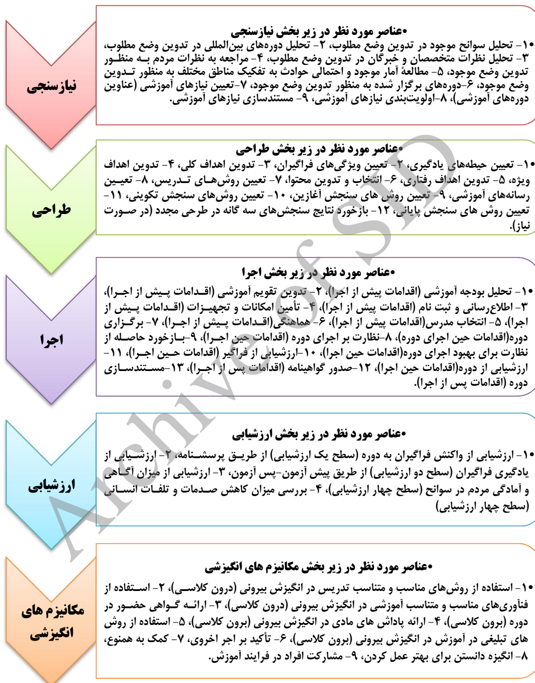
شکل شماره ۳- عناصر مورد نظر در مؤلفه‌های مدل آموزش همگانی

همچنین زیرمؤلفه‌های این مدل را در نمای شماتیک زیر (شکل شماره ۳) می‌توان مشاهده کرد: