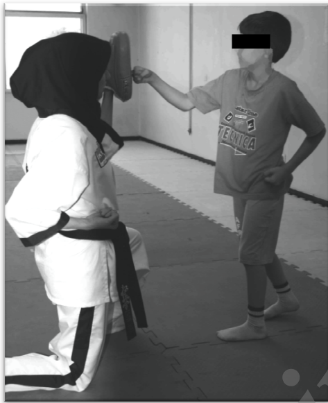
شکل ۱. اجرای تکنیک زوکی (Zuki) توسط کودک اوتیستیک تحت مطالعه با کمک مربی

(۴۸) و هدایت فیزیکی و جسمی (۴۹) برای آموزش تکنیک‌های منتخب کاراته به شرکت کننده استفاده شد. در روزهای فرد که شامل قسمت مداخله نیز می‌باشد، کودک در هیچ گونه فعالیت حرکتی شرکت نمی‌کرد، اما در همان زمان‌های مشابه با روزهای زوج در اتاق آموزشی در دو مرحله (هر کدام به مدت ۱۵ دقیقه) مورد مشاهده قرار می‌گرفت.