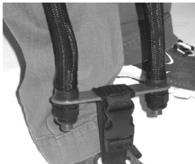
شکل ۴. بخش اتصال دهنده ی تحتانی

عدم پاسخگویی از سوی کمپانی سازنده پس از انجام مکاتبات مبنی بر امکان دسترسی به ارتوز، اندیشه ساخت ارتوز در ایران، با ویژگی‌های مشابه جهت انجام پژوهش بر روی افراد دارای ام اس را ایجاد نمود. جهت ساخت نمونه پیش ساخته از مواد مختلفی بهره گرفته شد و نمونه ساخته شده بر روی سه فرد مبتلا به ام اس مورد ارزیابی واقع گردید و پس از بهینه‌سازی، ارتوز لگنی- مچ پایی ساخته شد. بخش در برگیرنده کمربند لگنی که همانند یک ارتوز لومبوساکرال نیمه‌سخت می‌باشد و توسط استرپ در ناحیه قدامی بسته می‌شود. بخش خلفی کمربند لگنی دارای مقاومت بیشتری می‌باشد و توسط بارهای ترموپلاستیک تقویت شده است. علت این امر نیرویی است که در حین راه رفتن از سوی اندام مبتلا از طریق باندهای الاستیک به کمربند منتقل می‌گردد. دومین جزء ارتوز، باندهای الاستیک می‌باشد که در سمت داخل و خارج اندام مبتلا قرار گرفته و در بالا به کمربند لگنی و در انتها به بخش اتصال دهنده تحتانی توسط قطعه کوچکی متصل می‌گردد. بخش اتصال دهنده تحتانی سومین بخش ارتوز می‌باشد، که مشابه یک ارتوز کمک‌کننده جهت انجام درسی فلکشن مچ پا (Dorsiflexion Assist Orthosis)