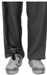
شکل ۳. باند های الاستیک