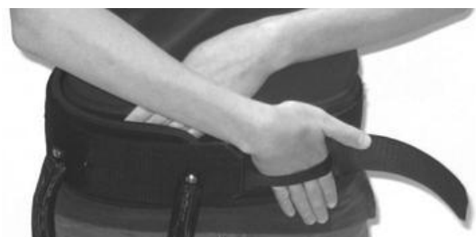
شکل ۲. کمربند لگنی ارتوز Hip Flexion Assist

چنانچه ارتوز، مفصل زانو و هیپ را در بر بگیرد وزن آن به شدت افزایش یافته و تحمل آن خارج از توان بیمار می‌باشد. حمایت از مفصل هیپ و مچ پا بدون در بر گرفتن زانو نیز تاکنون در ارتوزها موجود و مرسوم مقدور نبوده است. به نظر می‌رسد ارتوزی که بتواند علاوه بر مفصل مچ کمک به ضعف عضلات هیپ نموده و در عین حال مفصل زانو را در برنگیرد، بسیار کارآمد خواهد بود. وزن کم و سهولت پوشیدن و در آوردن ارتوز نیز می‌تواند به اثربخشی و پذیرش ارتوز توسط بیمار کمک کند (۱۸). ارتوزی با ویژگی‌های مذکور بر پایه دانش‌های موجود، در ایران موجود و مرسوم نمی‌باشد اما در یکی از مطالعات به ارتوزی اشاره شده که (Orthotic Hip Flexion Assist) نام داشته و به حرکت فلکشن در مفصل هیپ و درسی فلکشن در مفصل مچ کمک می‌نماید (۱۳، ۱۵). این ارتوز توسط Naft در سال ۲۰۰۸، جهت افراد مبتلا به بیماری ام اس دارای ضعف یک‌طرفه عضلات فلکسور هیپ ارائه گردید. این ارتوز در عین سبک بودن، به کنترل مفاصل اندام تحتانی در حین راه رفتن کمک می‌نماید و دارای سه بخش است: بخش کمربند لگنی که در سه سایز کوچک، متوسط و بزرگ موجود می‌باشد (شکل ۲)، دومین جز شامل باندهای الاستیک می‌باشد که در راستای اندام مبتلا و در سمت داخل و خارج آن قرار می‌گیرند (شکل ۳) و سومین قسمت ارتوز بخش اتصال دهنده تحتانی است که به کفش متصل می‌گردد (شکل ۴). تمامی اجزای این ارتوز قابل تنظیم با شرایط آناتومیکی و ویژگی‌های بیومکانیکی راه رفتن هر بیمار می‌باشد.