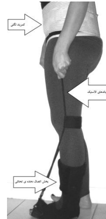
شکل ۵. ارتوز لگنی - مچ پای

بوده و از جنس نئوپرن می باشد. این بخش در برگیرنده مچ پاست و تا کمی قبل از سر متاتارس ها ادامه دارد و در ناحیه مچ توسط استرپ بسته می شود (شکل ۵).