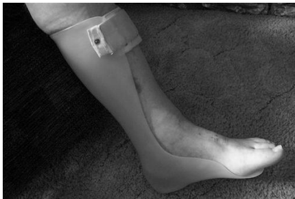
شکل ۱. ارتوز AFO

درمان حاضر جهت مشکلات ناشی از ام اس شامل درمان دارویی، فیزیوتراپی، کاردرمانی و ارتوپدی فنی می‌باشد (۱۲، ۱۳). گروهی از بیماران که دارای درگیری اندام تحتانی هستند، برای غلبه بر عدم کنترل هماهنگ عضلات جهت راه رفتن از عصا، واکر و کراچ بهره می‌برند و از مکانیزم‌های جبرانی راه رفتن شامل راه رفتن دایره‌وار و یا بلند کردن بیشتر لگن جهت جبران افتادگی مچ پا استفاده می‌کنند (۱۴). درمان ارتوپدی فنی در این بیماران، با توجه به ضعف عضلات مچ و هیپ و به دنبال افتادگی مچ پا بصورت متداول استفاده از AFO (Ankle Foot Orthosis) می‌باشد (شکل ۱) (۱۵، ۱۶).