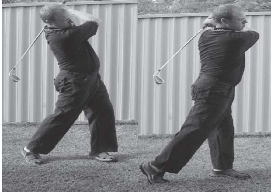
شکل ۳: سمت راست Swing کلاسیک و سمت چپ Swing مدرن (دارای C معکوس) می باشد.

نیروی چرخشی کمتری هنگام Swing کلاسیک به کمر وارد می شود. به همین دلیل Swing مدرن به عنوان مکانیسم پیشنهادی