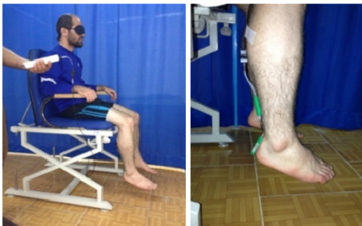
شکل ۲. نحوه نشستن روی صندلی برای انجام تست

ابتدا از هر آزمودنی خواسته شد تا با چشمان باز سه مرتبه مچ پای خود را تا زاویه هدف حرکت داده و به مدت سه ثانیه در همان وضعیت نگه دارد و آنرا در حافظه کوتاه مدت خود حفظ کند. سپس، جهت حذف مداخله بینایی در حین اندازه‌گیری، چشمان شخص مورد آزمایش توسط چشم‌بند بسته شده و از وی خواسته شد که مچ پای خود را به صورت فعال حرکت دهد و زاویه هدف را بازسازی نماید (شکل ۲).