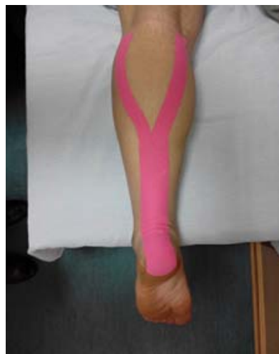
شکل ۱. نحوه چسباندن تیپ

آنالیز درون گروهی با استفاده از آزمون t زوجی در گروه KT مهاری در قبل و بعد از درمان نشان داد که تفاوت معنی‌داری در نتیجه تست TUG ( P = 0/001 ) و FR ( P = 0/001 ) وجود داشت. این تغییر معنی‌داری در نتایج تست‌های FR ( P = 0/02 ) و TUG ( P = 0/001 ) برای گروه تسهیلی نیز مشاهده شد. مقایسه بین دو گروه با استفاده از t مستقل نشان داد که قبل از درمان نتایج آزمون‌های TUG ( P = 0/81 ) و FR ( P = 0/79 ) در دو گروه با یکدیگر تفاوت معنی‌داری نداشت. ۳۰ دقیقه بعد از KT نیز دو گروه در هیچ یک از دو آزمون (به ترتیب P = 0/56 و P = 0/89 ) تفاوت معنی‌داری نشان نداد (شکل ۲).