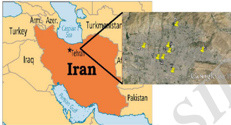
شکل ۲: مراکز رادیوتراپی مورد ارزیابی

EEC ضریب تعادل رادن با دخترانش است که برای محیط بسته ۰/۴ در نظر گرفته می شود و ۱۲ ضریب دز جذبی برای رادن است. occupancy factor برابر با میزان ضریب حضور فرد در سال