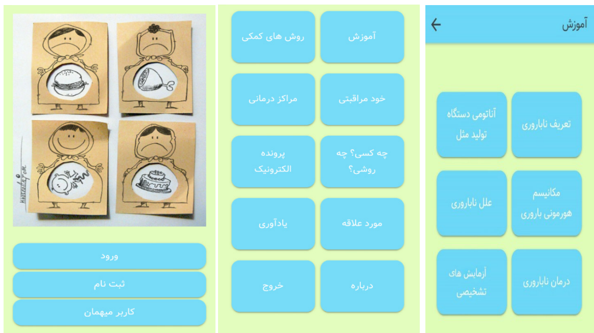
شکل ۱: نمای از صفات برنامه‌ی کاربردی

جدول شماره‌ی سه با عنوان ابزارهای مدیریت بیماری با دو زیرمجموعه یادآورها و ردگیری طراحی شده است که یادآور زمان مصرف داروها در زیرمجموعه اول و ردگیری میزان مصرف داروها بر اساس دستور پزشک در زیرمجموعه دوم موفق به دریافت بیشترین امتیازها شدند. در پاسخ‌های شرکت‌کنندگان پاسخی با میزان تاثیر بی‌اثر، خیلی کم و کم یافت نشد. طبق نظر شرکت‌کنندگان تنها دو آیت قد و نوع بیمه‌ی تحت پوشش با میزان تاثیر متوسط در آیت‌های پرسش‌نامه وجود داشت. همچنین سه آیت با تاثیر زیاد شامل نام و نام خانوادگی، شغل و