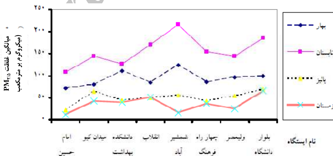
نمودار ۲: مقایسه میانگین غلظت PM_{2.5} مناطق مختلف شهر خرم‌آباد به تفکیک فصل