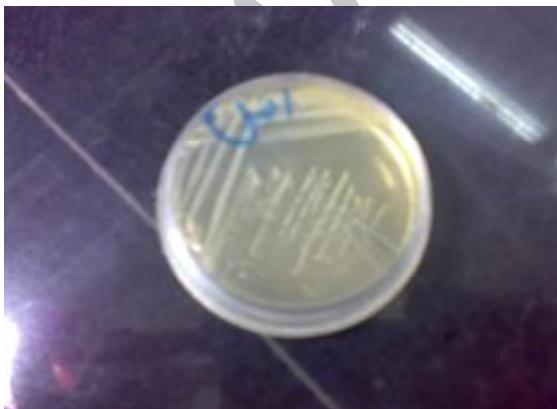
عکس 1- کلنی های لاکتوباسیلوس ایزوله شده در محیط کشت MRS آگار

در این بررسی از 100 نمونه منابع مختلف که در جدول (1) نشان داده شده است، لاکتوباسیلوس ها، لاکتوکوکوس ها و مخمرهای مولد لاکتات زیر به دست آمد (جدول 2) از بین این لاکتوباسیلها، L. Delbrueki (10 مورد)، L. Bulgaris (10 مورد)، L. Salivarius (8 مورد)، L. Casei (5 مورد)، L. Agilis (3 مورد)، L. Alimentarius (2 مورد)، L. Amylophilus (2 مورد)، L. Animalis (2 مورد)، L. Brevis (2 مورد)، L. Fructose (2 مورد)، L. Plantarum (3 مورد)، L. Divergence (2 مورد)، L. Vitulines (1 مورد)، L. Acidophilus (2 مورد)، L. Maltaromicus (1 مورد)، Lactococcus. Thermophilus (12 مورد)، Lactococcus. Lactis (2 مورد)، Lactococcus. Lactis Leuconostic lactis (1 مورد)، subsp. Cremoris (1 مورد) و همچنین مخمرهای مولد لاکتیک اسید (12 مورد) ایزوله و نگهداری گردید. همچنین سایر میکروارگانیسمهایی که مولد اسید لاکتیک نبوده 17 مورد رشد کرده بود که دور انداخته شد.