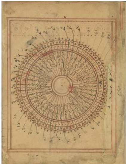
تصویر صفحه فهرست تقویم الأبدان، نسخه مجلس شورا، ش ۱۴۵۶۹، سده ۷ق.

«حمی الروح، حمی العفن والدق، الأورام و أصنافها، الأمراض العارضة لظاهر البدن لأسباب من باطنه، الأمراض العارضة لظاهر الوجه والرأس، الأمراض العارضة لظاهر اليدين والرجلين، الجراحات والقروح، قروح و حرق النار وإخراج الأزجة و من ضرب بالسيّاط، نهش الحيوان ذي السمّ و لدغه، الأدوية القتالة، الصداع و أوصافه، أمراض الدماغ، أمراض النخاع، أمراض الجفن، أمراض الملتحم، أمراض القرنية، أمراض الماق والعنبيّة و ما يعرض بين القرنية والجلدية، أمراض عصب البصر و أوجاع الأذن، أمراض الأذن، أمراض الأنف، علل آلة الشمّ، أمراض اللسان، أمراض الشفتين، أمراض الأسنان واللثة واللهاة، أمراض الحلق والحنجرة والرية و قصبته، نفثة الدم والمدة و أمراض غشا الأضلاع والحجاب والقلب، أمراض المرئ و فم المعدة، أمراض المعدة، علل الأمعاء والسفل، أمراض الكبد، الاستسقاء و أمراض المرارة والطحال، أمراض الكلى والطحال، أمراض المثانة والصفاق والأنثيين، أمراض الأنثيين والقضيب، افراط الشهوة الجماع و سيلان المنى، أمراض الرحم والثدي، أمراض الوركين والرجلين والمفاصل، خاتمة».