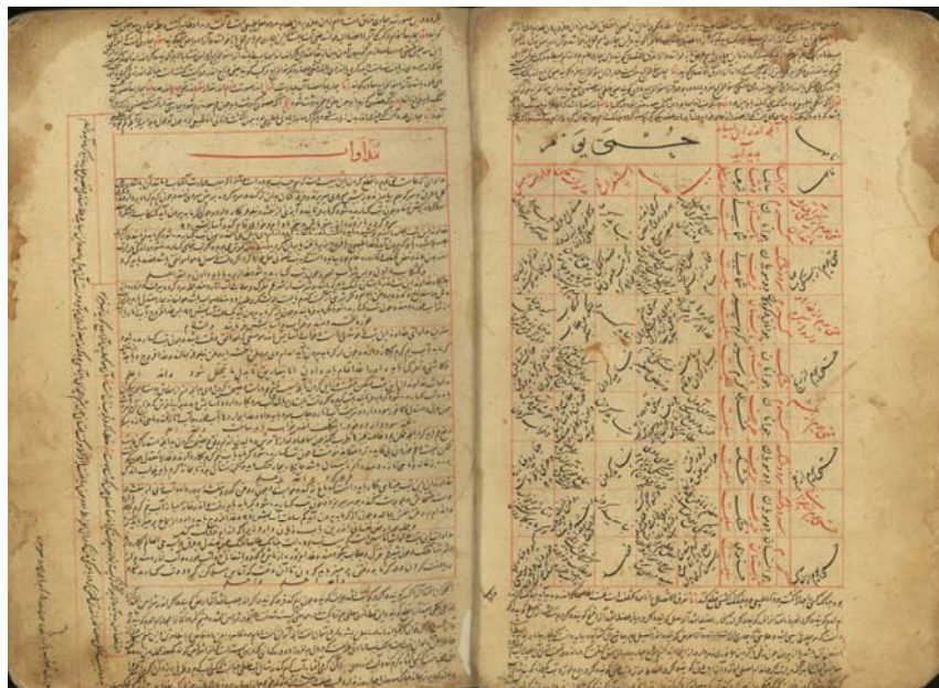
تصویر صفحاتی از ترجمه سپهسالار علی بن عبدالله، کتابت ۸۷۴ق. (متعلق به مجلس شورای اسلامی، ش ۴۹۷)

علاوه بر آن، منزوی دو نسخه از آن یاد کرده (نسخه‌ها، ج ۱، ص ۴۹۷) و دو نسخه در دانشکده پزشکی تهران (فهرست، ص ۳۱) و نسخه‌ای به صورت میکروفیلم در دانشگاه تهران (۵۸، ۸۱۹) و... موجود است.