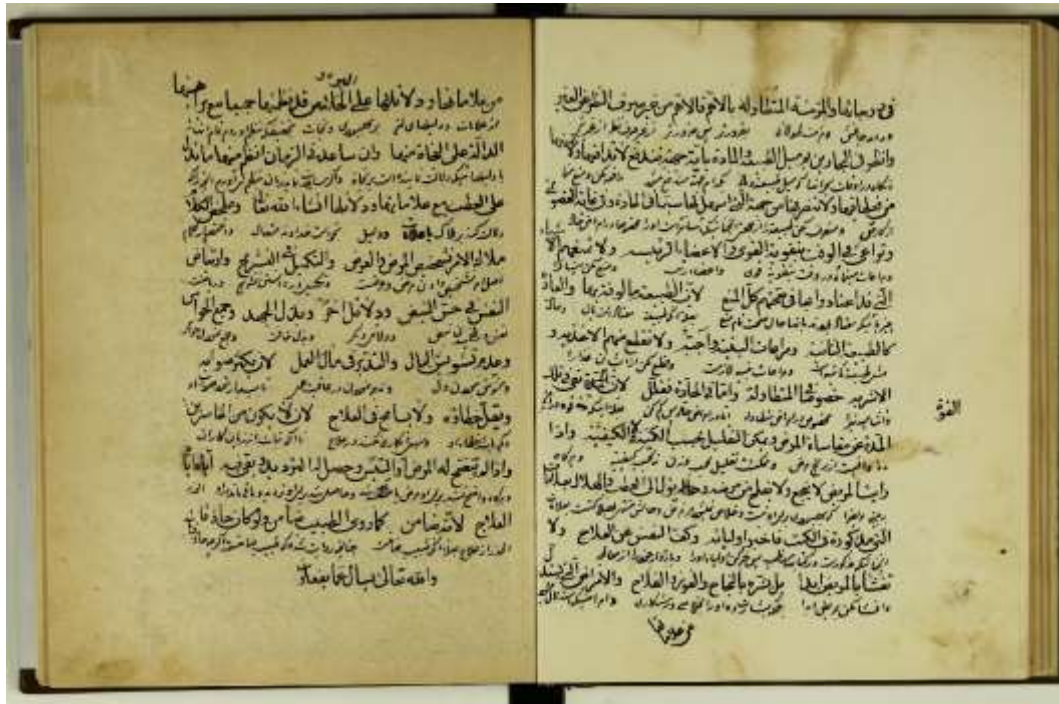
تصویر ۳: صفحات پایانی نسخه خطی کتاب