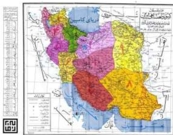
تصویر ۱: نقشه ایالت فارس