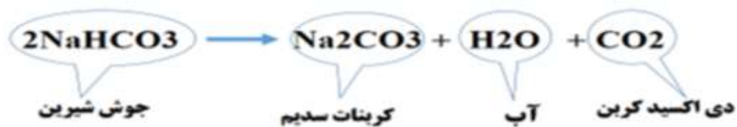
شکل ۲: فرمول تجزیه جوش شیرین در حرارت