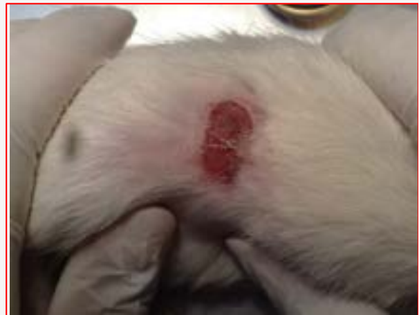
شکل ۱- نمونه زخم سوختگی درمان شده با پماد سولفادiazین نقره ۱٪ در پایان هفته چهارم

با توجه به شرایط مشابهی که برای گروه‌های مختلف این مطالعه اعمال شد و استفاده از داروی سولفادiazین نقره ۱٪ با عارضه اسکار کمتری همراه بود، پیشنهاد می‌گردد با توجه به عدم آگاهی از استریل بودن روغن حیوانی و کیفیت آن از داروهای