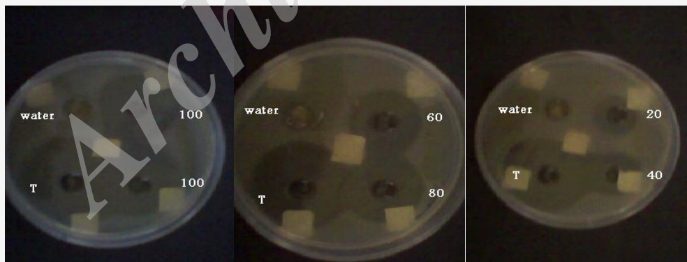
شکل ۳: نواحی بازداری باکتری آئروموناس هیدروفیلا در غلظت‌های مختلف نانو ذرات CuO

با افزایش درصد نانو ذرات و در پی آن غلظت آن‌ها، ناحیه