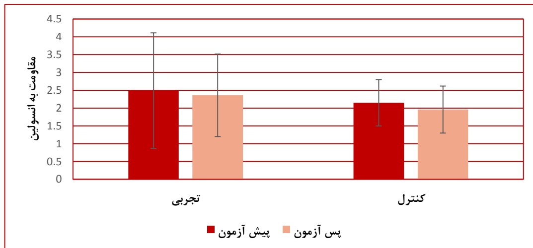
نمودار ۲- مقایسه میانگین (± انحراف معیار) مقاومت به انسولین دو گروه پیلاتس و کنترل