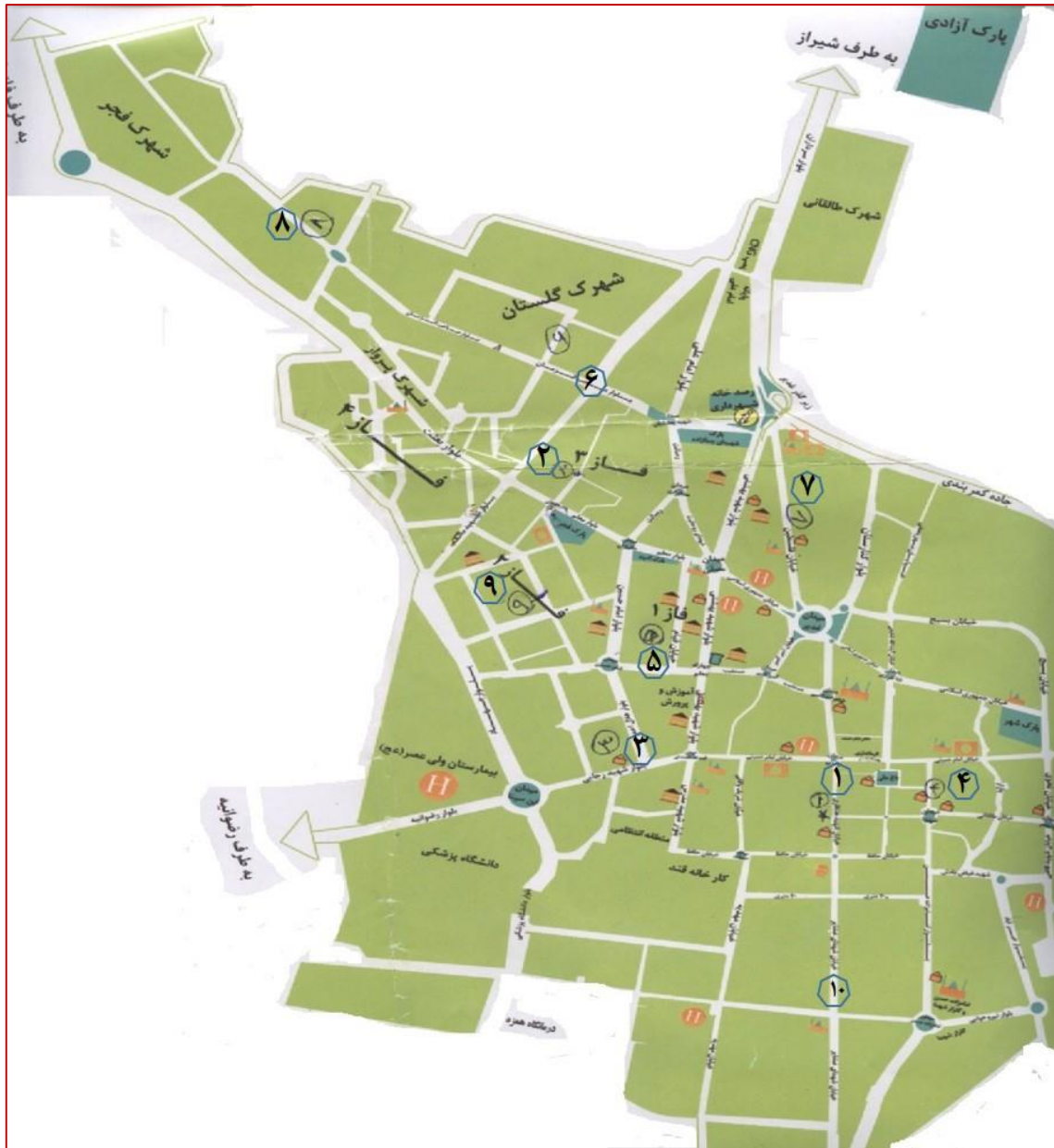
شکل ۲- موقعیت ده نقطه نمونه برداری رادن در منازل مسکونی شهر فسا

نمونه‌گیری، شمارش ردپاهای رادن و میزان غلظت رادن برحسب (Bq/m^3) را نشان می‌دهد.