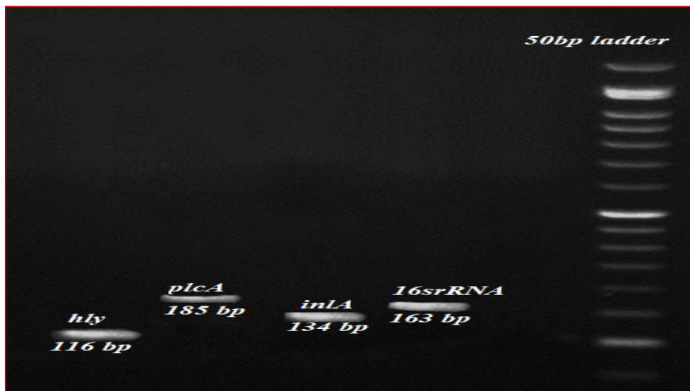
شکل ۱- الکتروفورز محصولات ژن‌های hly، plcA و inlA و 16SrRNA باکتری لیستریامونوسیوتوژنز در حضور مارکر 50bp

برای تأیید حضور ژن‌های مورد مطالعه در باکتری لیستریامونوسیوتوژنز تکنیک واکنش زنجیره‌ای پلیمرز انجام شد، سوییچ مورد مطالعه واجد تمام ژن‌های مورد بررسی، یعنی hly، plc و inlA بود (شکل ۱).