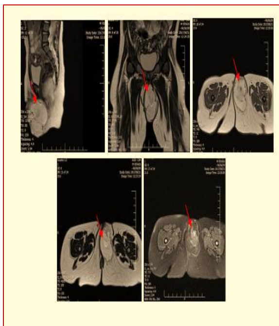
شکل ۱- MRI لگن بیمار که نشان‌دهنده‌ی توده نزدیک سمفیز پوبیس و راموس تحتانی چپ پوبیس است