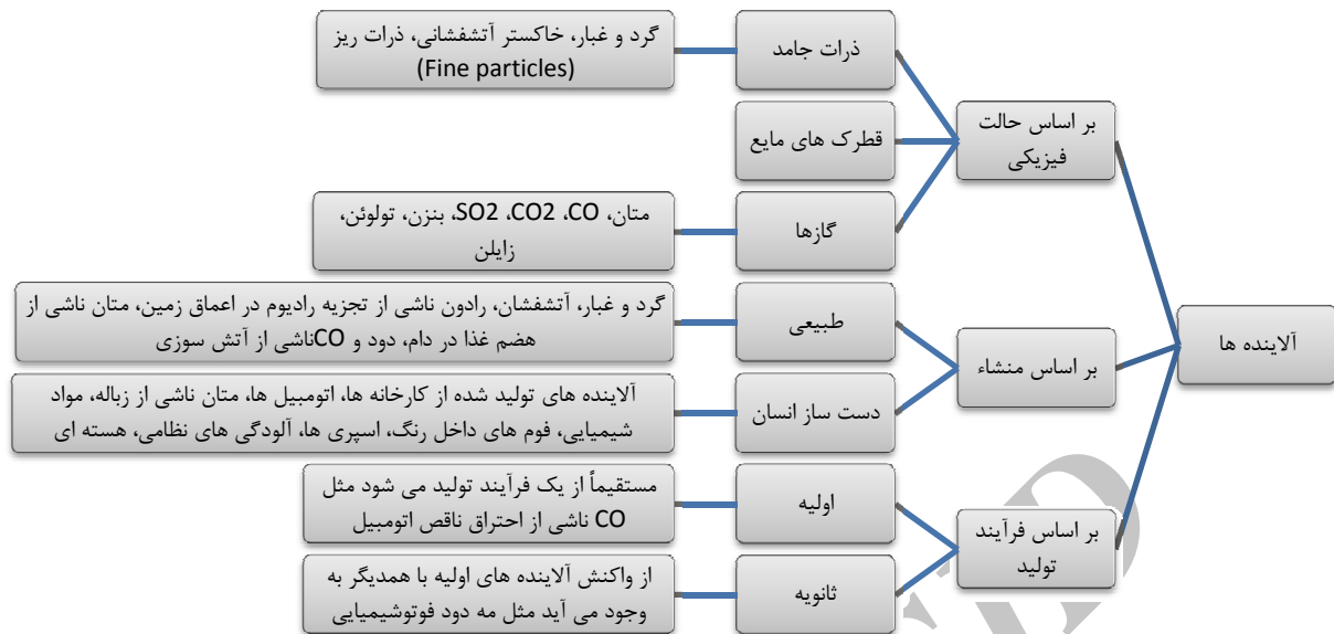
شکل ۲: تقسیم بندی آلاینده ها در دانش امروزی (۳۲)