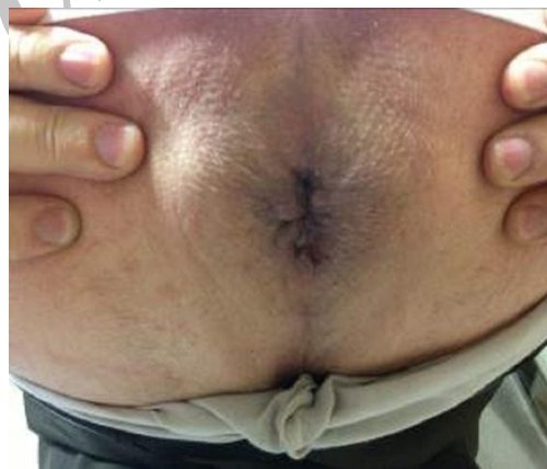
عکس شماره ۳: سومین جلسه درمان بیمار