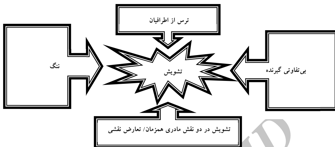
شکل ۲. چگونگی شکل گرفتن درون مایه تشویش

و جنین حاصل از آن‌ها به رحم مادر جایگزین انتقال می‌یابد. گروهی از فقهای معاصر این روش را نامشروع دانسته‌اند. مانند آیت‌الله فاضل لنکرانی که بیان نمودند: "جنین حاصل از نطفه غیر زوج جایز نیست". البته آیات عظام خامنه‌ای و مکارم شیرازی عمل مزبور را در صورت اجتناب از حرام، فاقد منع شرعی می‌دانند (۱۶). از نظر حقوقی نیز با توجه به قانون نحوه اهدای جنین به زوج‌های نابارور مصوب ۱۳۸۲/۵/۸، انتقال جنین‌های اهدایی که توسط زوج‌های بارور در محیط آزمایشگاهی لقاح یافته‌اند، در رحم زوجه ناباروری که وی یا همسرش و یا هر دو دارای مشکل نازایی هستند، منع قانونی نخواهد داشت (۱۷). در مطالعه آرامش، تجربه این زنان از مسایل اخلاقی بررسی شده است که بیان می‌کند فقهای اهل تسنن رحم اجاره‌ای را نپذیرفته‌اند و اهل تشیع هم تنها برای زوج‌های قانونی و تحت شرایط مشخصی آن را قبول دارند (۱۸). در روش اجاره رحم با تخمک اهدایی نیز می‌توان دو فرض را تصور نمود. در فرضی که تخمک اهدایی از زن ثالث است و یا آن که تخمک اهدایی مادر جایگزین می‌باشد که البته در هر دو فرض تخمک زنان بیگانه است که با اسپرم پدر حکمی که با آن‌ها رابطه‌ای ندارد، در محیط آزمایشگاه لقاح یافته و به رحم مادر جایگزین انتقال می‌یابد (۱۸). در این خصوص بنا به نظر فقها به مانند آیت‌الله مکارم شیرازی و آیت‌الله صافی گلپایگانی ایشان قایل به وجوب احتیاط هستند