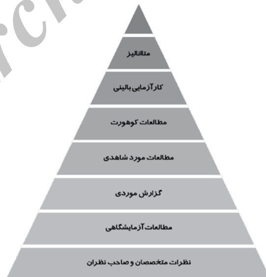
تصویر ۱: هرم مبتنی بر شواهد

با در نظر گرفتن ملاحظات اخلاقی و عدم پیش داوری درمورد داروی خاص مطالعات مورد بررسی قرار گرفت و بهترین داروها (داروهای دارای بیشترین کارایی و کمترین عارضه در کنترل درد حاد پس از اعمال جراحی ارتوپدی) به همراه بهترین دوز، روش و زمان تجویز آن‌ها انتخاب شد. با هماهنگ نمودن جلسه هم‌اندیشی با حضور ۱۰ نفر از اعضای هیات علمی به